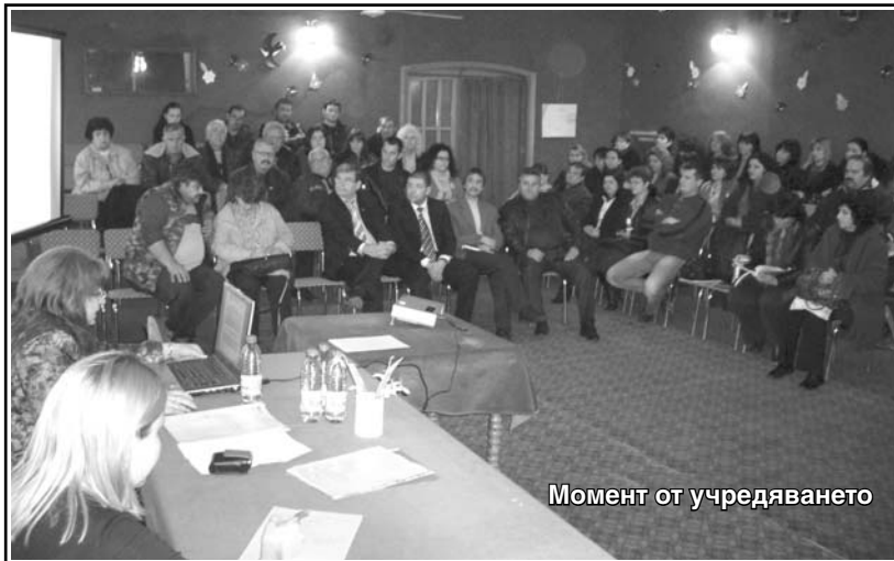
Момент от учредяването

прие председателят и зам.-председателят на сдружението да са от квотата на община Браçигово, а това съгласно устава означава, че нашата квота за първата година ще е 4-ма човека. След направени предложения и проведено гласуване, се избра следният състав на Управителния съвет на сдружение с нестопанска цел "МЕСТНА ИНИЦИАТИВНА ГРУПА /МИГ/ на