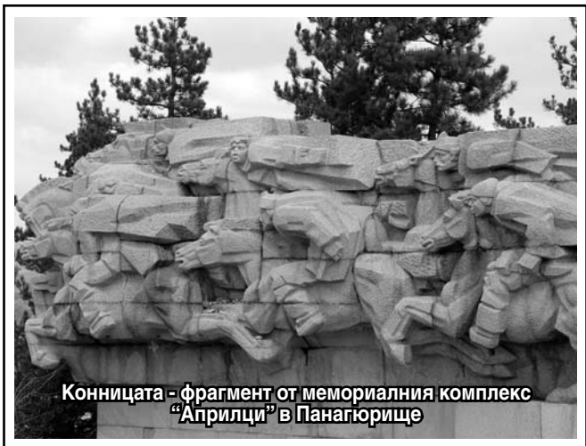
Конницата - фрагмент от мемориалния комплекс „Априлци“ в Панагюрище

В Перушица се държат девет дни срещу пет-шестхиляден враг от башибозуци, редовна войска и доброволци, командвани