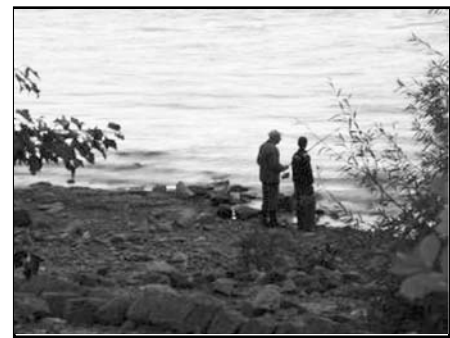
през 2005 г. е отбелязано началото на Второто международно десетилетие