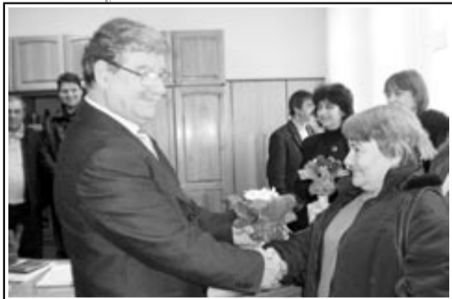
на родината поощ. Младите и старите баби в цялата община се радваха на вниманието и празнуваха. Как? – четете на страница 4