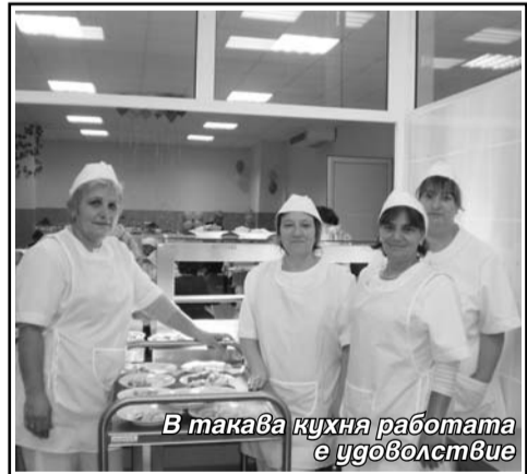
В такава кухня работата е удоволствие

нията – от кмета на общината, от гостите и от спонсорите. „В началото бях скептик, че за една година може да се създаде такава бижу на кулинарната технология. Радвам се, че бях опроверган“ – каза г-н Вендел.