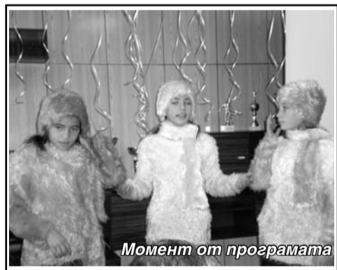
Момент от програмата