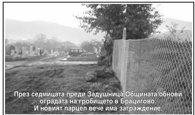
През седмицата преди Задушница Общината обнови оградата на гробището в Брацигово. И новият парцел вече има ограждение.

И както на всеки събор, и тук не липсваха люлките, сергии, традиционният захарен памук и ухаещите скари.