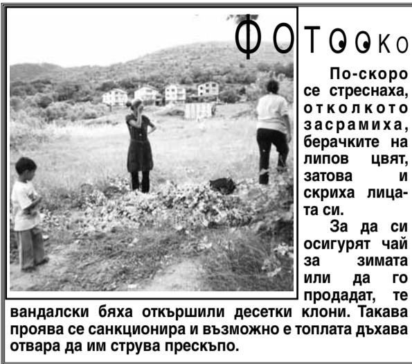
Фотото По-скоро се стреснаха, отколкото засрамираха, берачките на липов цвят, затова и скриха лицата си. За да си осигурят чай за зимата или да го продадат, те вандалски бяха открили десетки клони. Такава проява се санкционира и възможно е топлата дъхва отвара да им струва прескъпо.

Настоящата Заповед да се сведе до знанието на всички заинтересовани лица за съдържание и изпълнение.