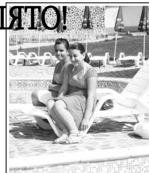
Вместо край морето, на Джулай морнинг край басейна

Д. Серафимов е категоричен - на младежи под 18 години не се сервира алкохол, а